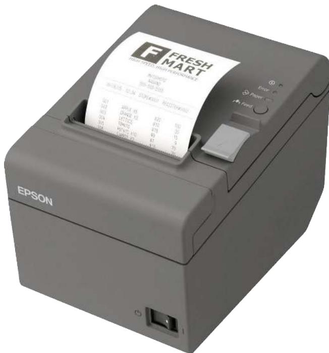
Bondrucker „Epson TM-T20II“