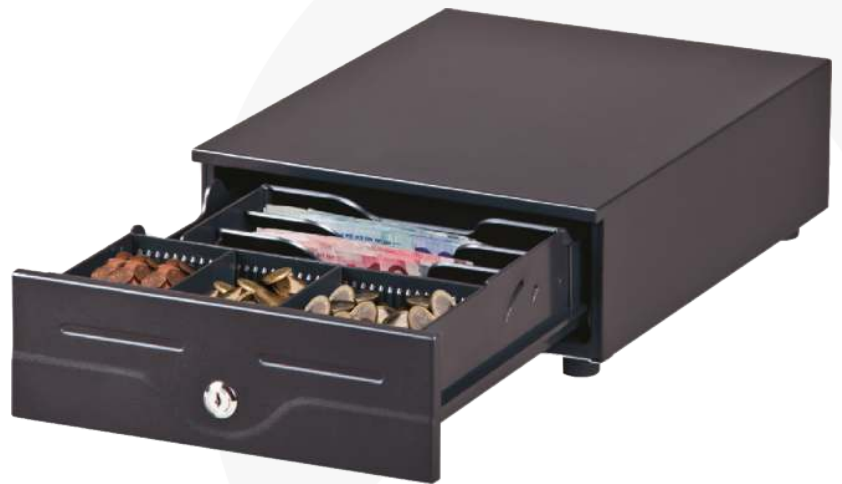
Kassenslade „Metapace K-4“

Alle abgebildeten Hardwareprodukte können Sie über uns beziehen. Gerne erstellen wir ein persönliches, unverbindliches Angebot für Sie.