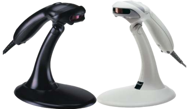
Handscanner „Honeywell Voyager 9540“

Das Modul BARVERKAUF unterstützt die Anbindung von Kassenhardware, um Barumsätze einfach zu erfassen. Nachfolgend Beispiele von möglichen Kassenhwaresystemen: